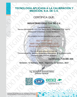
IMAGEN PROTEGIDA POR LA LEY DE DERECHOS DE AUTOR POR EL INSTITUTO MEXICANO DE LA PROPIEDAD INDUSTRIAL No. 299964