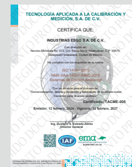
IMAGEN PROTEGIDA POR LA LEY DE DERECHOS DE AUTOR POR EL INSTITUTO MEXICANO DE LA PROPIEDAD INDUSTRIAL No. 299964