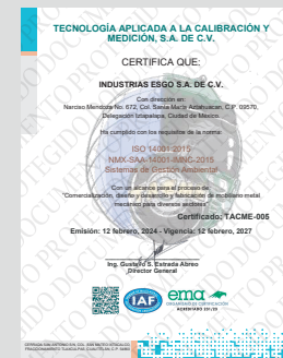
IMAGEN PROTEGIDA POR LA LEY DE DERECHOS DE AUTOR POR EL INSTITUTO MEXICANO DE LA PROPIEDAD INDUSTRIAL No. 299964

Industrias Esgo, S.A. de C.V. Correo: ventas@esgo.com.mx Teléfono: (55) 15 46 20 30 Narciso Mendoza No. 672 Col. Santa María Aztahuacán 09570 México D.F.