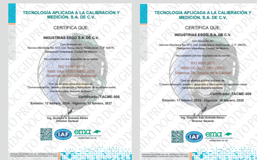
IMAGEN PROTEGIDA POR LA LEY DE DERECHOS DE AUTOR POR EL INSTITUTO MEXICANO DE LA PROPIEDAD INDUSTRIAL No. 299964

Sistema de Gestión de Calidad certificado en los estándares ISO 9001:2015 e ISO 14001:2015