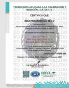
IMAGEN PROTEGIDA POR LA LEY DE DERECHOS DE AUTOR POR EL INSTITUTO MEXICANO DE LA PROPIEDAD INDUSTRIAL No. 299964