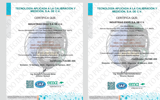
IMAGEN PROTEGIDA POR LA LEY DE DERECHOS DE AUTOR POR EL INSTITUTO MEXICANO DE LA PROPIEDAD INDUSTRIAL No. 299964

Sistema de Gestión de Calidad certificado en los estándares ISO 9001:2015 e ISO 14001:2015