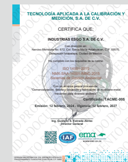
IMAGEN PROTEGIDA POR LA LEY DE DERECHOS DE AUTOR POR EL INSTITUTO MEXICANO DE LA PROPIEDAD INDUSTRIAL No. 299964

Industrias Esgo, S.A. de C.V. Correo: ventas@esgo.com.mx Teléfono: (55) 15 46 20 30 Narciso Mendoza No. 672 Col. Santa María Aztlahuacán 09570 México D.F.