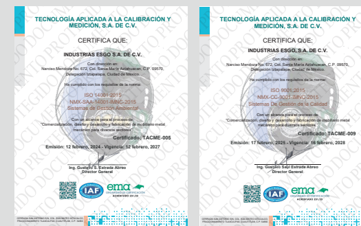
IMAGEN PROTEGIDA POR LA LEY DE DERECHOS DE AUTOR POR EL INSTITUTO MEXICANO DE LA PROPIEDAD INDUSTRIAL No. 299964

Sistema de Gestión de Calidad certificado en los estándares ISO 9001:2015 e ISO 14001:2015