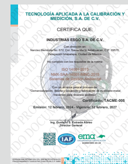
IMAGEN PROTEGIDA POR LA LEY DE DERECHOS DE AUTOR POR EL INSTITUTO MEXICANO DE LA PROPIEDAD INDUSTRIAL No. 299964