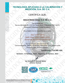
IMAGEN PROTEGIDA POR LA LEY DE DERECHOS DE AUTOR POR EL INSTITUTO MEXICANO DE LA PROPIEDAD INDUSTRIAL No. 299964