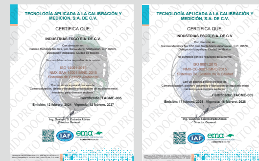
IMAGEN PROTEGIDA POR LA LEY DE DERECHOS DE AUTOR POR EL INSTITUTO MEXICANO DE LA PROPIEDAD INDUSTRIAL No. 299964

Sistema de Gestión de Calidad certificado en los estándares ISO 9001:2015 e ISO 14001:2015