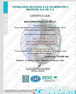
IMAGEN PROTEGIDA POR LA LEY DE DERECHOS DE AUTOR POR EL INSTITUTO MEXICANO DE LA PROPIEDAD INDUSTRIAL No. 299964