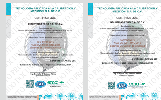
IMAGEN PROTEGIDA POR LA LEY DE DERECHOS DE AUTOR POR EL INSTITUTO MEXICANO DE LA PROPIEDAD INDUSTRIAL No. 299964

Sistema de Gestión de Calidad certificado en los estándares ISO 9001:2015 e ISO 14001:2015