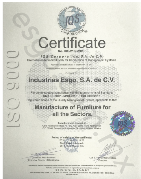
IMAGEN PROTEGIDA POR LA LEY DE DERECHOS DE AUTOR POR EL INSTITUTO MEXICANO DE LA PROPIEDAD INDUSTRIAL No. 299964

Todos nuestros productos tienen una garantía de 2 años contra defectos de fabricación y portan una etiqueta para su identificación. La ausencia de la misma puede dejar sin efecto dicha garantía.